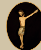
JORNADAS MARTIRIALES DE BARBASTRO